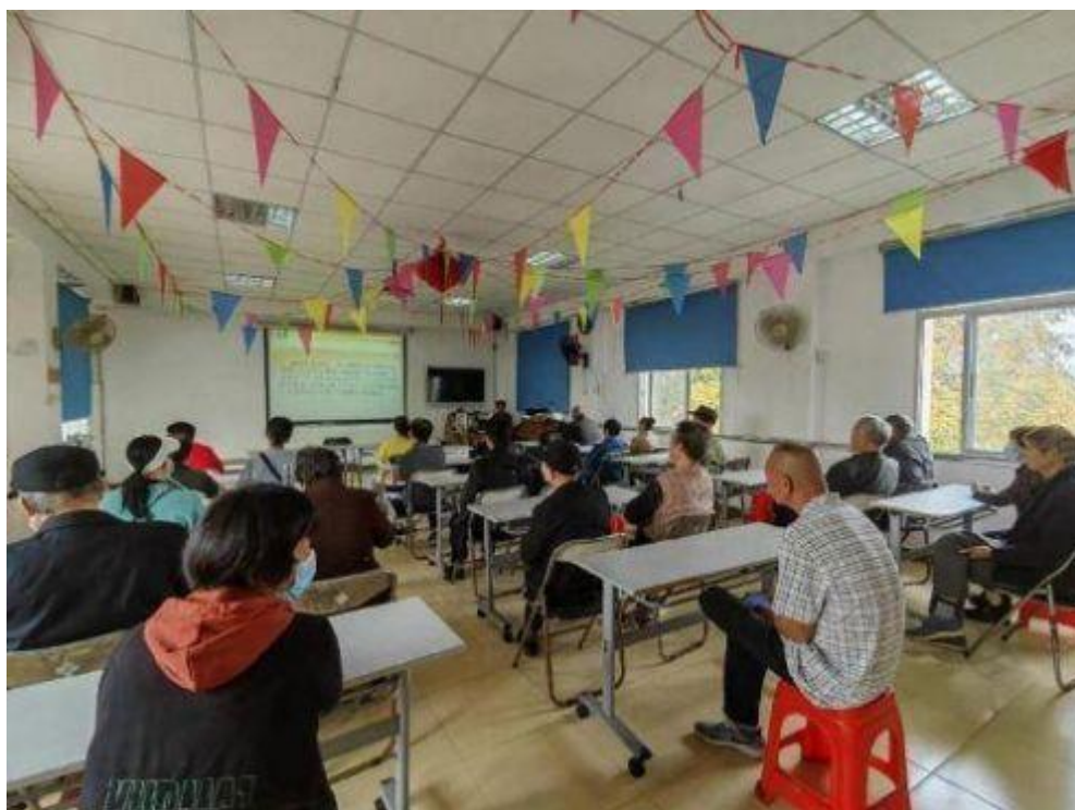
8、社区党建室，地址：北塔小区 50 号二楼