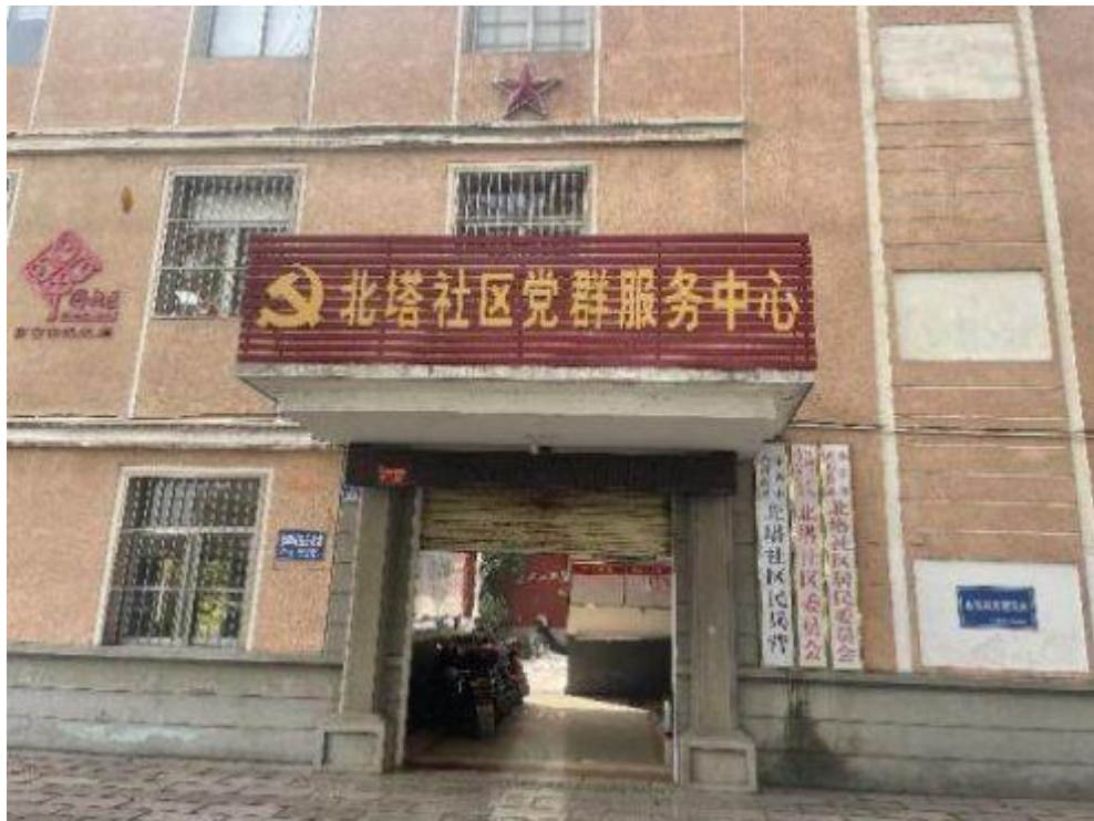
5、北塔社区便民服务站，地址：北塔小区 50 号二楼