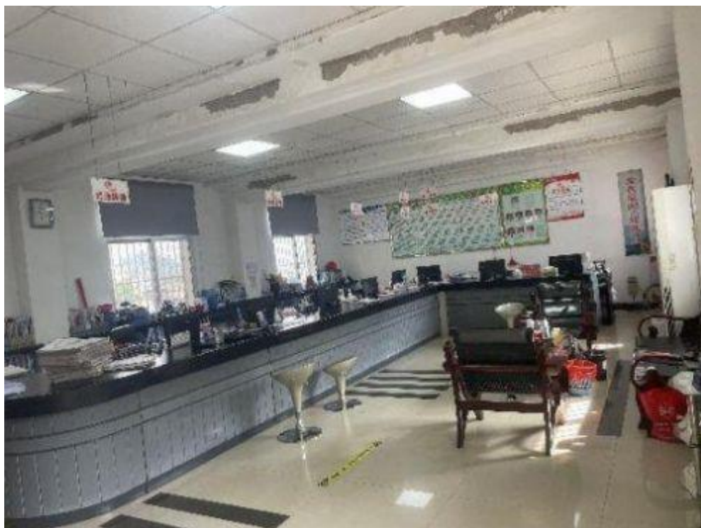
6、北塔社区公示栏，地址：北塔小区 50 号一楼