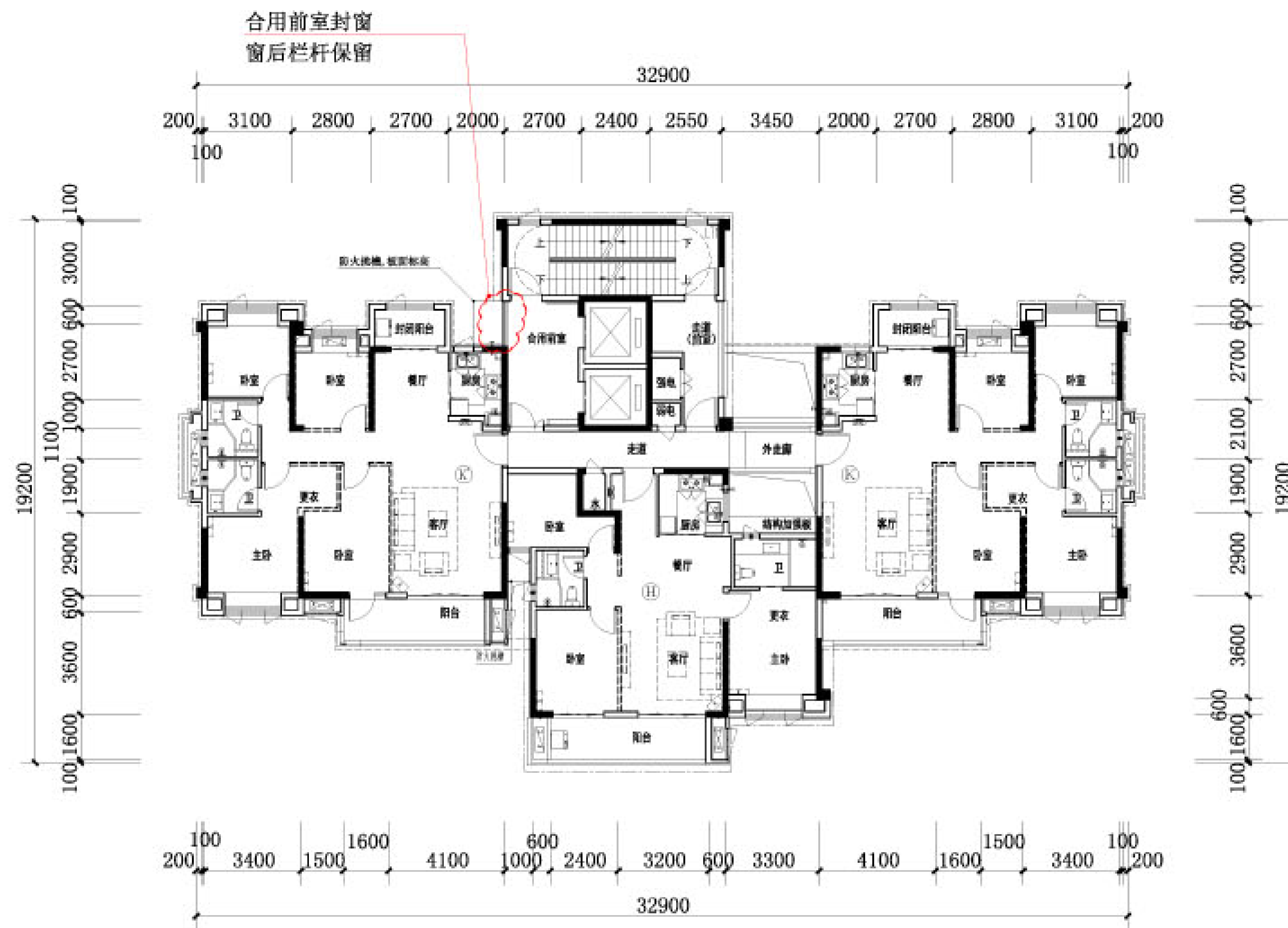
8#楼标准层平面图 (变更后)