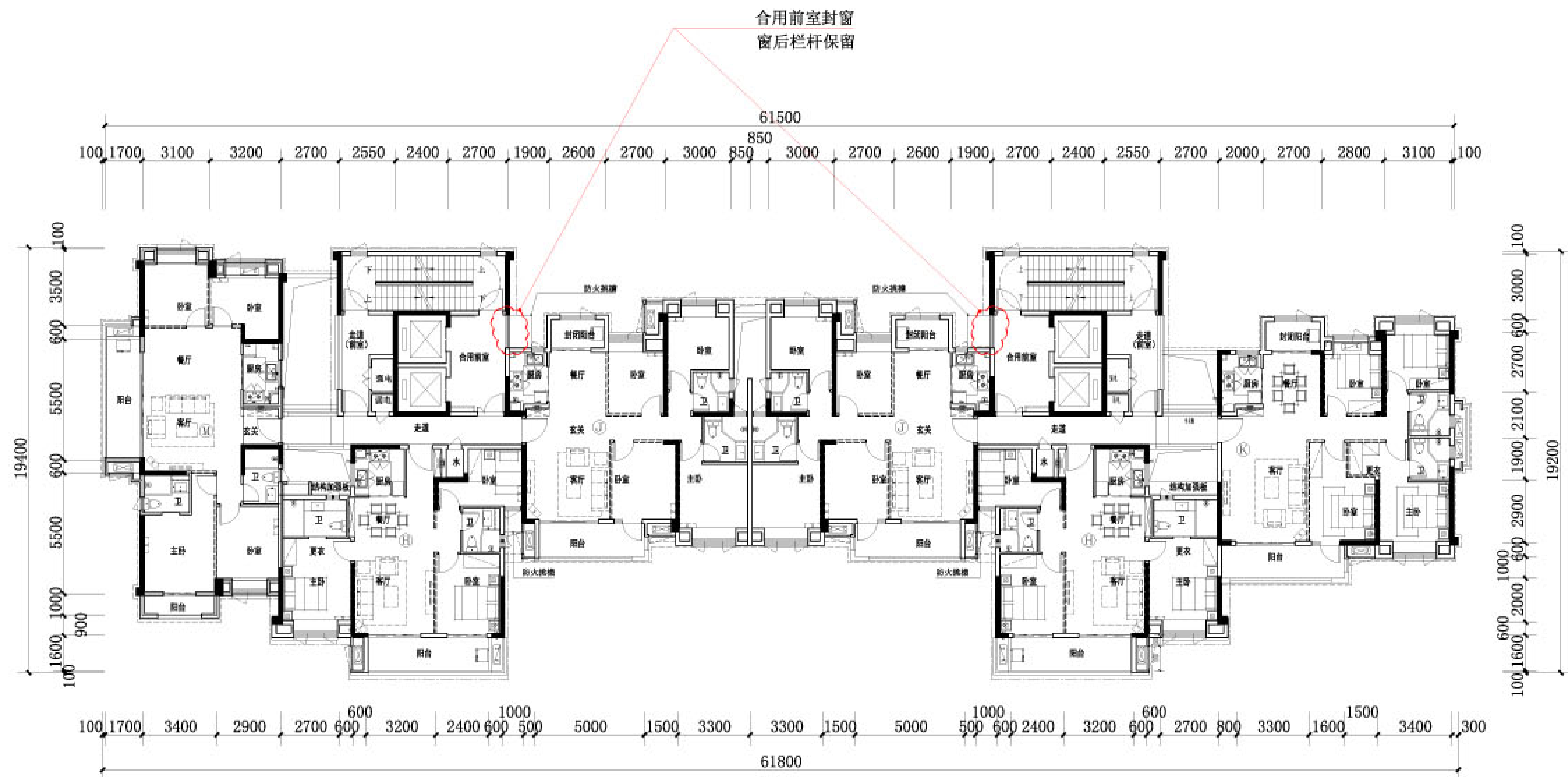
5、7#楼标准层平面图(变更后)